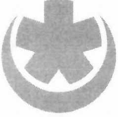
TİP1 UMKE LOGOSU: 175x150cm