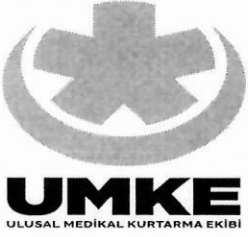
TİP3 UMKE LOGOSU: 50x50cm